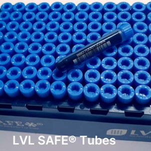
LVL SAFE® Tubes