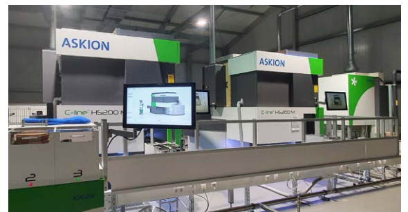
Einlagerung im automatischen Lagersystem