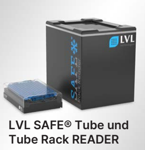
LVL SAFE® Tube und Tube Rack READER