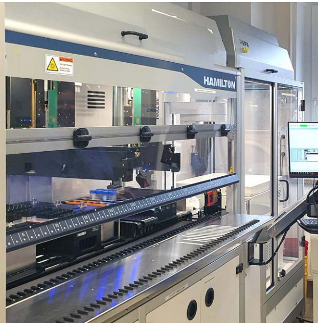
LVL SAFE® Tubes im automatischen Liquid Handling System