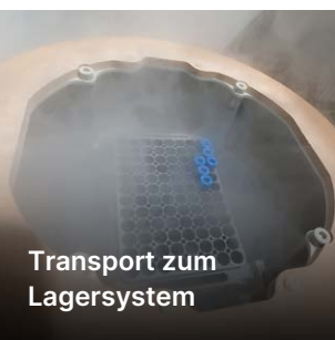
Transport zum Lagersystem